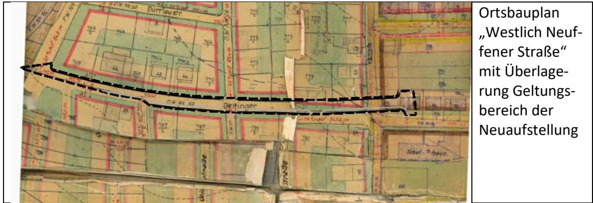
Ortsbauplan „Westlich Neufener Straße“ mit Überlagerung Geltungsbereich der Neuaufstellung

Zur endgültigen Herstellung der Dettinger Straße wurde eine Planungsvariante durch das Büro IBV Ambacher erarbeitet, da der im Ortsbauplan vorgesehene Ausbau mit einer Gesamtstraßenbreite von 8,0 m, welcher wie folgt aufgeteilt sein sollte,