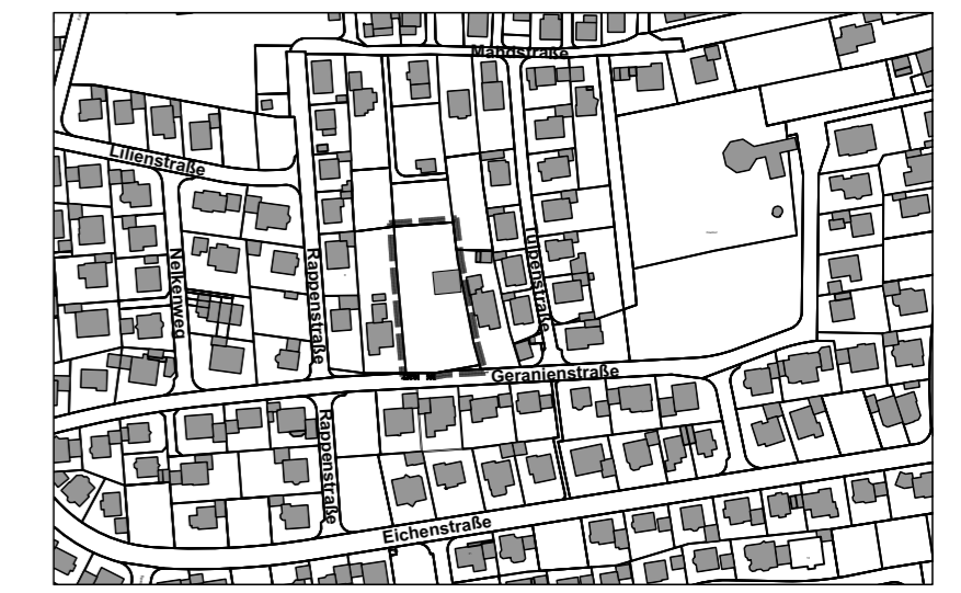
Übersichtslageplan ohne Maßstab